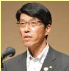
北村 一郎 Ichiro Kitamura 栃木県総合政策部長