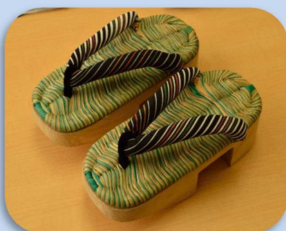
にっこうげた 日光下駄