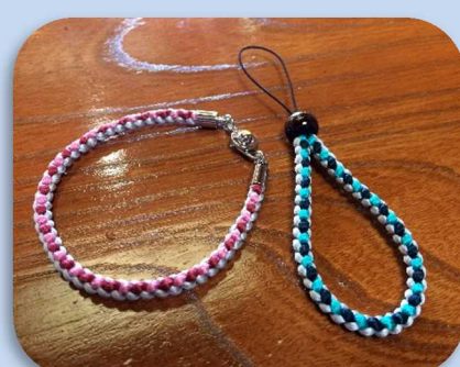
ままだひも 間々田紐