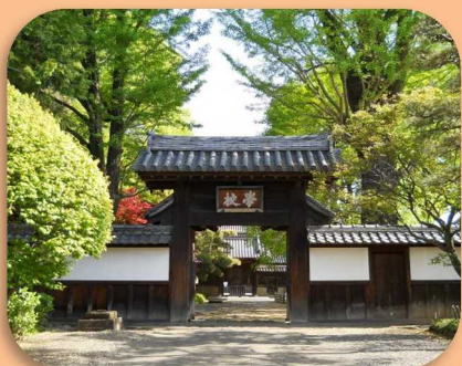
しせきあしかががっこう 史跡足利学校