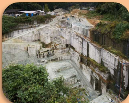
おおやしぶんか 大谷石文化