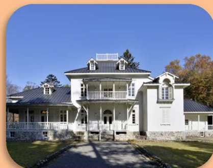
なすの はらかいたく 那須野が原開拓