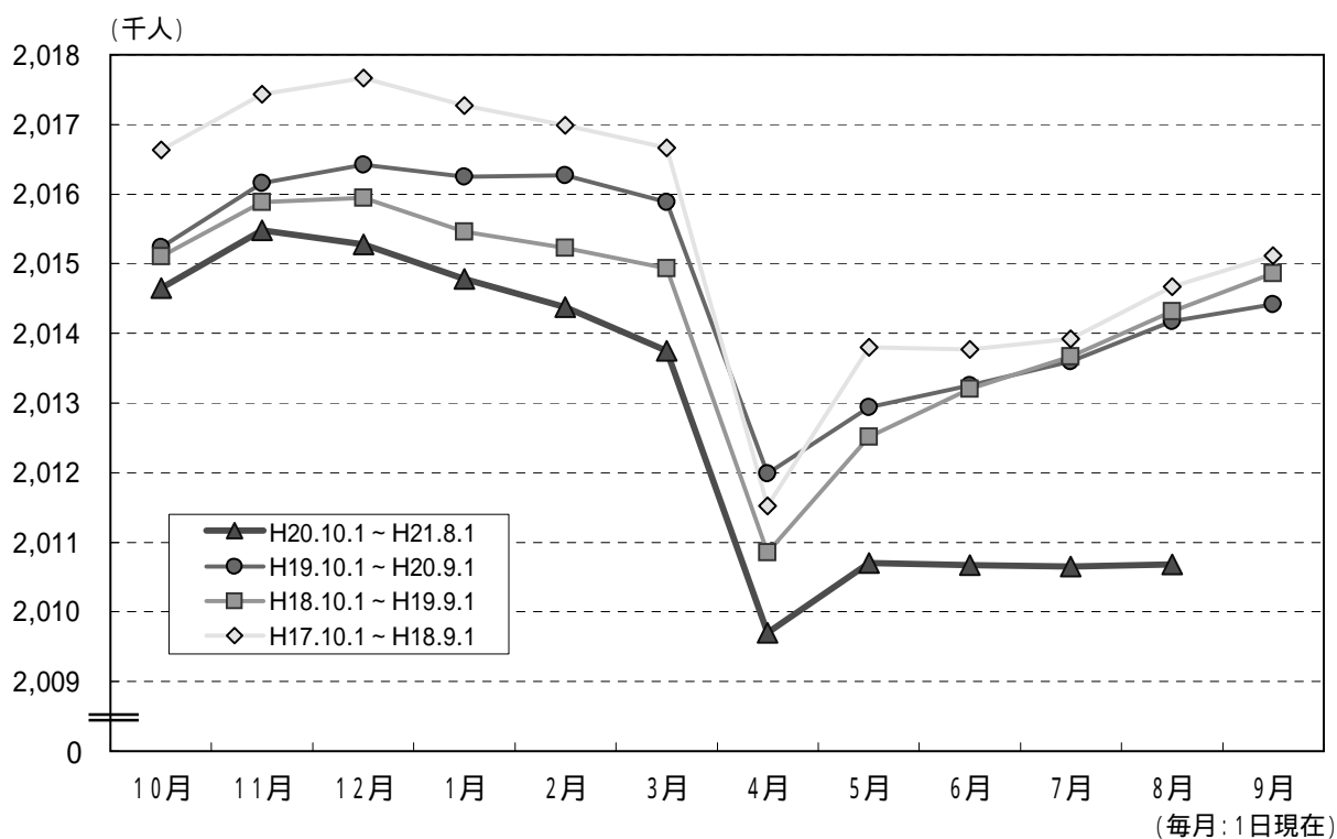
図2 自然・社会動態の推移 (平成19年7月中～平成21年7月中)