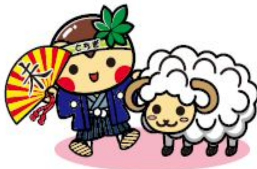
表1 未年生まれの人口