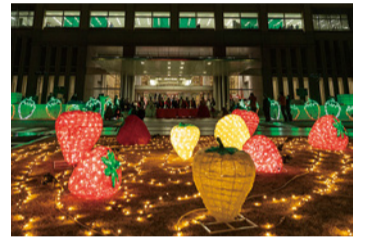
光のいちご畑(県庁県民広場)

県産農産物や「いちご王国」のPR、「とちぎの星」をはじめとする県産米のデジタルプロモーションなどを実施します。