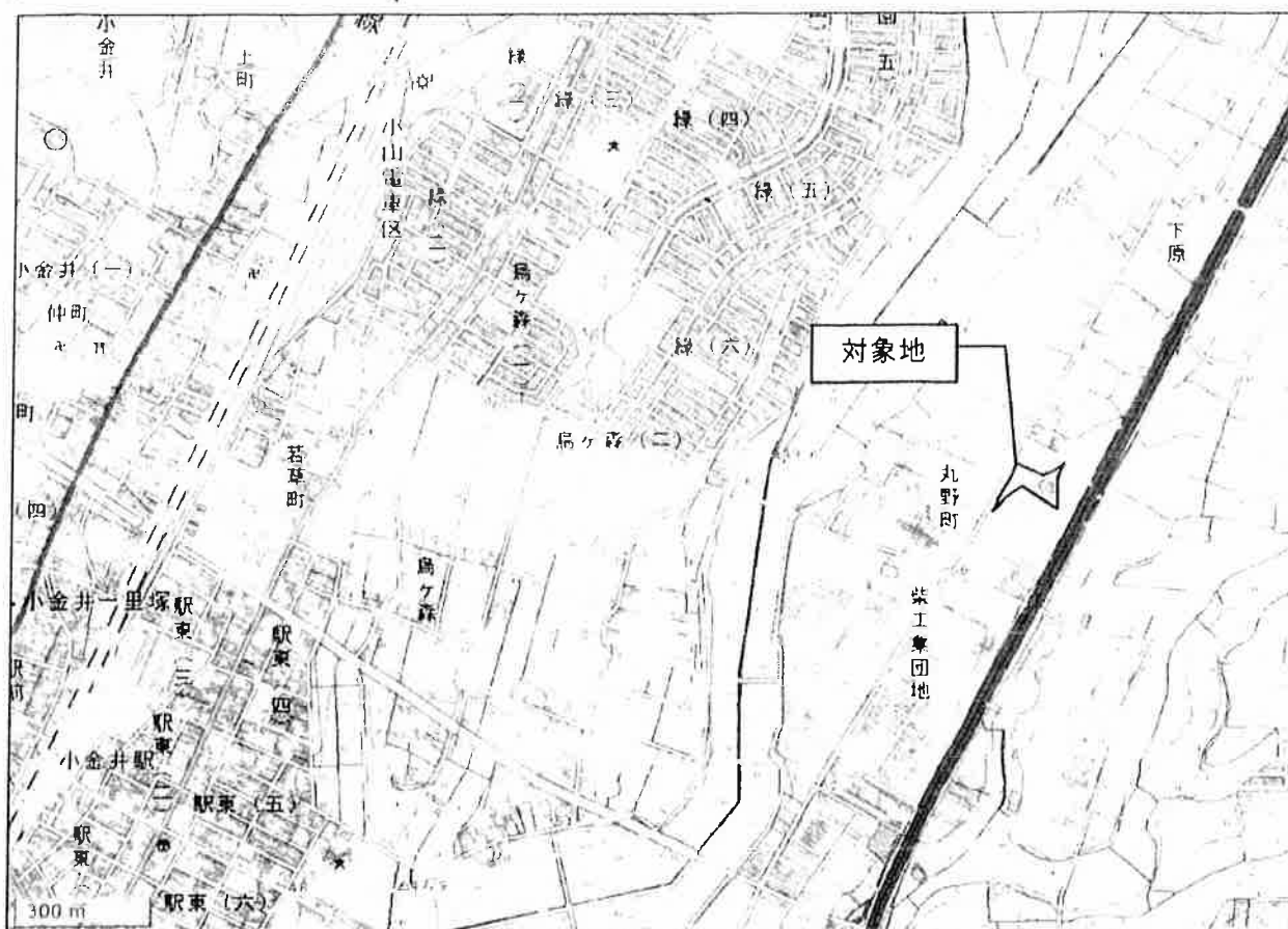
図 1.2.1 対象地の案内図