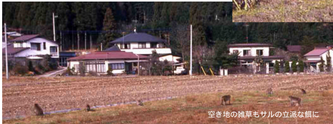
空き地の雑草もサルの立派な餌に