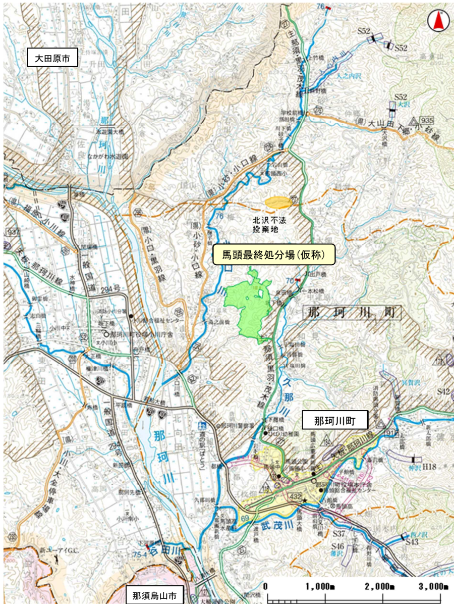
別紙3 事業計画地位位置図（馬頭最終処分場（仮称）事業区域及び北沢不法投棄地）