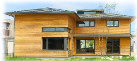
写真：とちぎ材を使用した住宅の一例