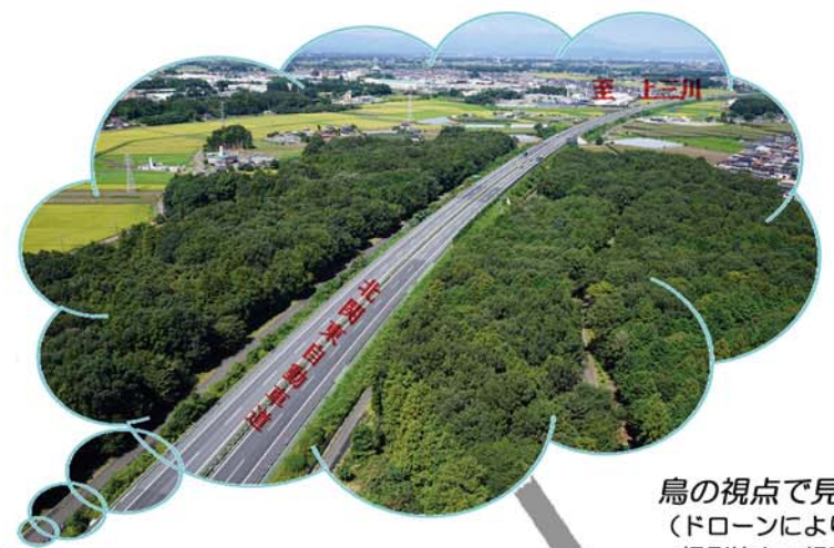
鳥の視点で見ると!! (ドローンにより撮影)