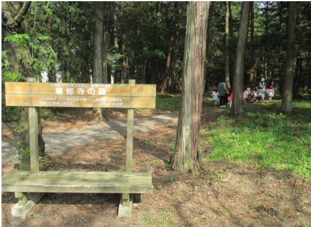
地域の憩いの場として