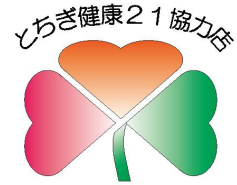
とちぎ健康21協力店のマーク

県民の皆さんが外食するときに、自分に合った食事を選択したり、栄養や食生活に関する適切な情報が得られるよう、栄養成分表示、ヘルシーメニューの提供、とちぎ健康づくり応援弁当の販売、健康情報発信、禁煙・分煙などに取り組む飲食店、スーパーマーケット、コンビニエンスストアなどを「とちぎ健康21協力店」として登録し、県民の健康づくりを支援しています。