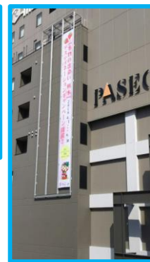
宇都宮アールメッツ