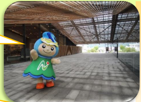
那珂川町馬頭広重美術館