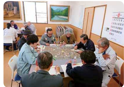
地域農業の将来に向けた話し合い