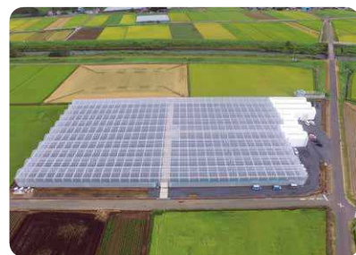
次世代型ハウス(トマト)