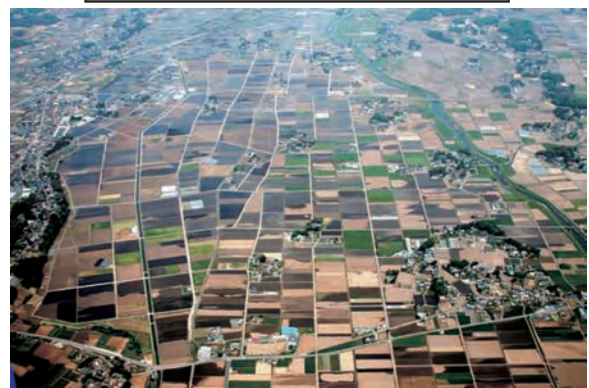
江川五千石地区(下野市)