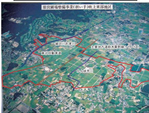
吹上東部地区(栃木市)