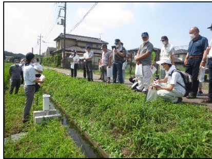
自動給水栓検討会