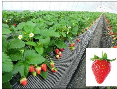
将来のいちご団地を想定して