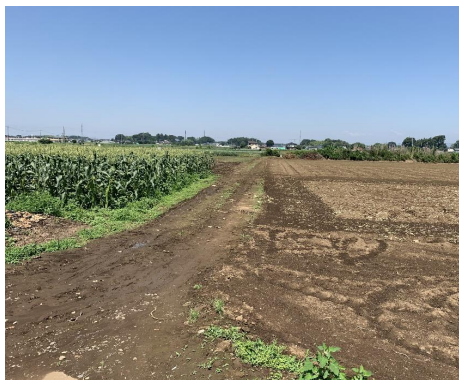
( 農道の様子 )