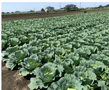
( 露地野菜の作付状況 )