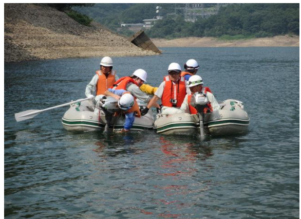
トラブル状況② (トラブルボートを曳航)