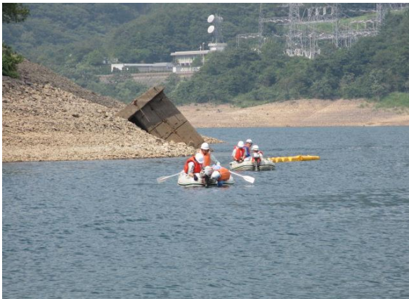
トラブル状況① (係留ロープがスクリューに巻く着く)