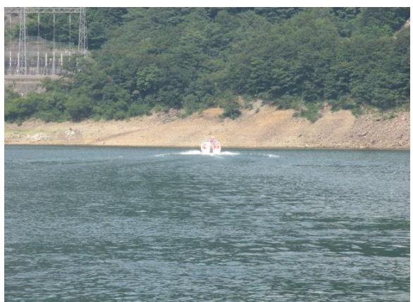
モーターボートによる湖面確認②