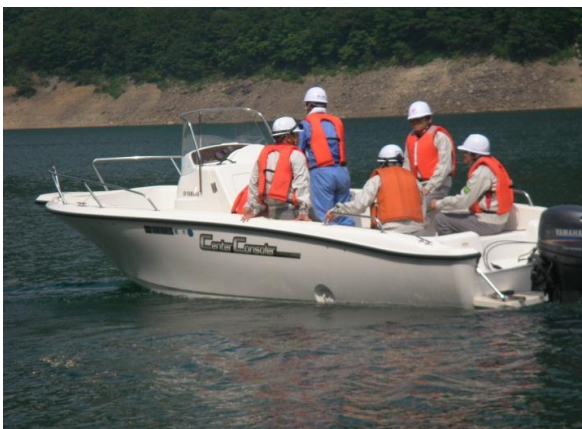
モーターボートによる湖面確認①