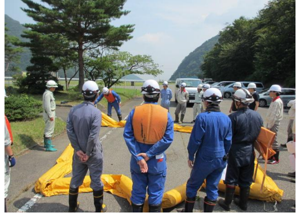
オイルフェンスの取扱い説明