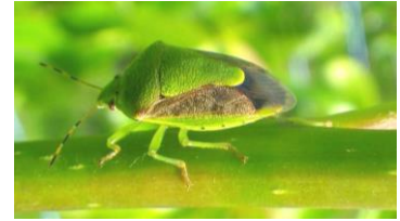
写真1 チャバネアオカメムシ成虫

また、今年は果樹カメムシ類の主要な餌であるヒノキ球果の結果量が一昨年及び昨年と比較して多く、果樹カメムシ類が繁殖しやすい環境にあります。そのため、次世代成虫が発生する8月以降の飛来数が多くなる可能性がありますので、果樹園地では飛来状況をこまめに確認し、飛来を確認したら速やかに防除を行いきましょう。