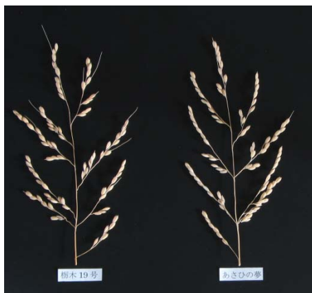
とちぎの星の穂相 (左：とちぎの星，右：あさひの夢)