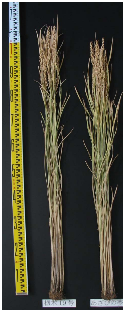
とちぎの星の草姿 (左：とちぎの星，右：あさひの夢)