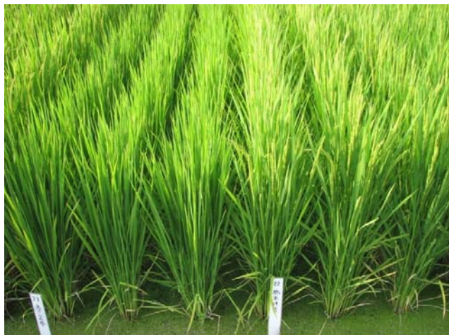
とちぎの星の立毛：出穂期 (左：あさひの夢，右：とちぎの星)