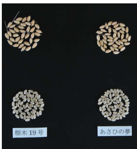
とちぎの星の粳と玄米 (左：とちぎの星，右：あさひの夢)