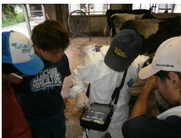
超音波妊娠診断機の説明の様子

なお、父親は、泌乳能力と体型改良力に優れた血統であり、雌の子牛が無事に生まれることが望めます。