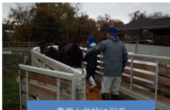
農業大学校に到着

また、この 2 頭の導入牛はどちらも妊娠しており、来年 3 月に分娩予定です。現在、学生たちは出産を心待ちにしながら、愛情をかけて飼養管理をしています。