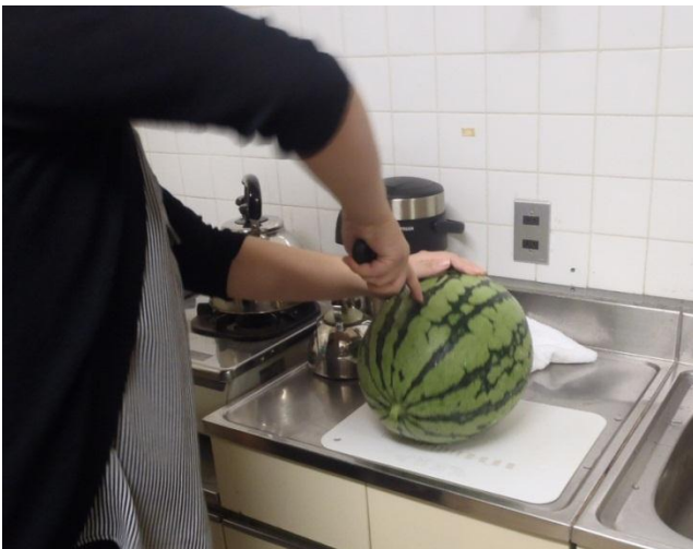
どきどきしながら包丁をいれます