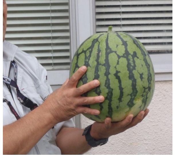
ずっしりと中身が詰まっている予感…