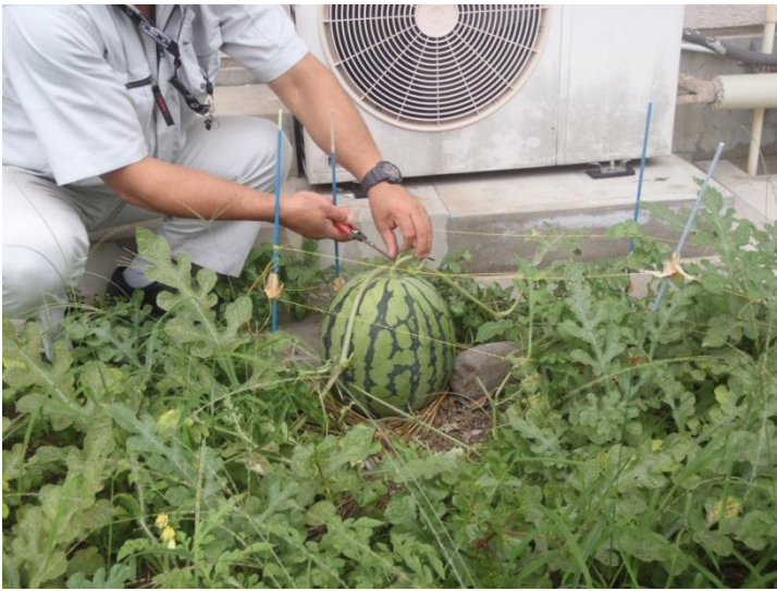
冷房の室外機のそばで育つスイカ

どのような環境でもたくましく生きる力強さを、この夏、ど根性スイカに教えてもらいました！