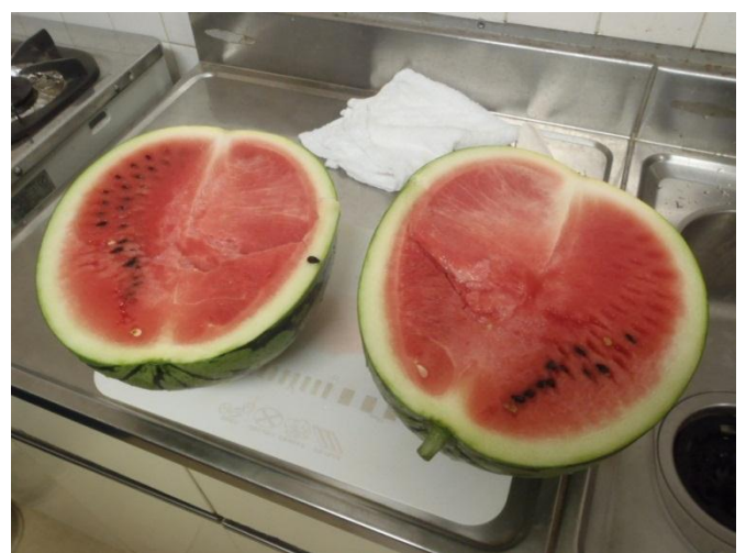
少し熟し気味でしたが美味しく頂きました！