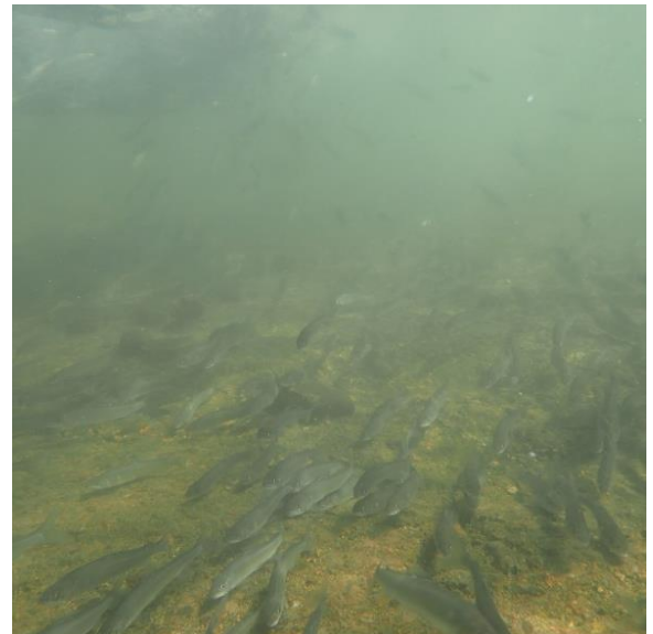
放流直後のアユのようす

※標識アユが釣れた場合には、水産試験場（0287-98-2888）までご連絡下さい。