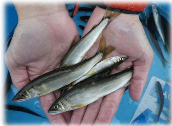
採捕された天然アユ