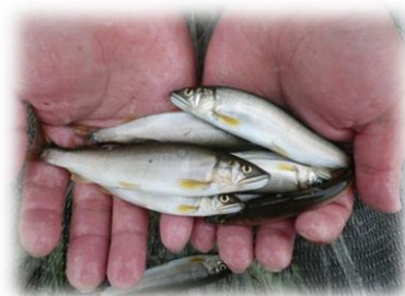
採捕された天然アユ