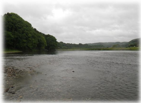
調査地点（テイテイ淵下流）