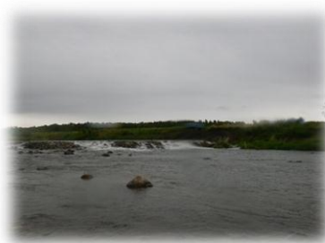
調査地点（野沢川合流点）