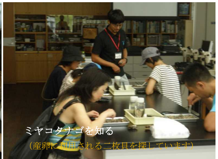
ミヤコタナゴを知る (産卵に利用される二枚貝を探しています)

この他に、外来魚コクチバス、アユ（天然と放流との違いなど）について体験型の講座を開催し、栃木の水産について理解を深めていただきました。