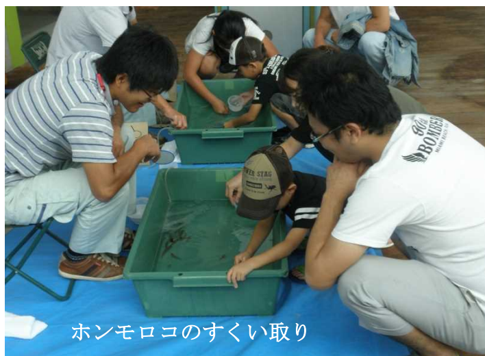
ホンモロコのすくい取り