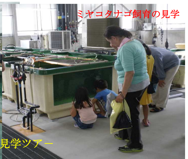
ミヤコタナゴ飼育の見学