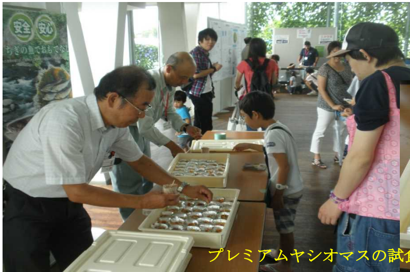
プレミアムヤシオマスの試食