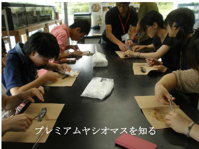
プレミアムヤシオマスを知る