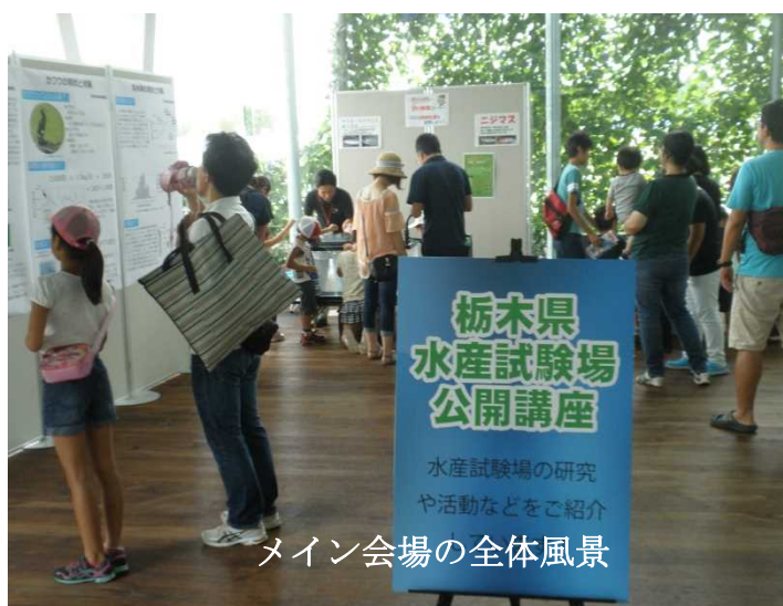
メイン会場の全体風景

2,085名もの多くの方に見学いただき、ありがとうございました。来年のご来場をお待ちしています。