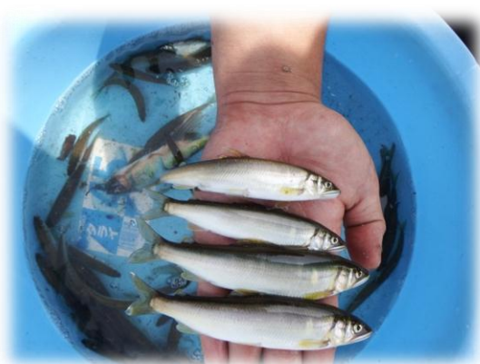
採捕された天然アユ (5/14)