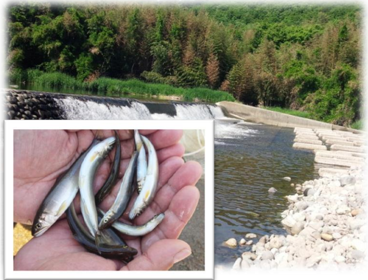
矢組堰のようすと採捕された天然アユ (5/14)