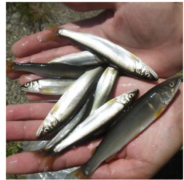
採捕された天然遡上アユ