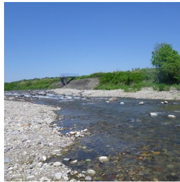
金沢地区のようす