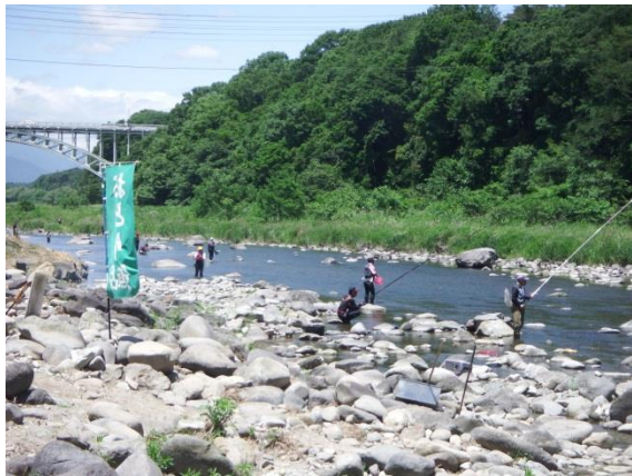
黒磯地区のようす