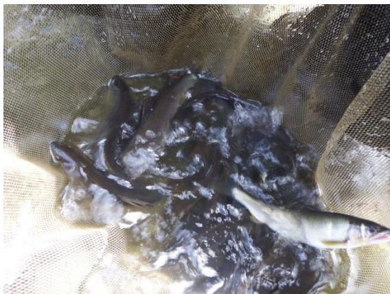
釣獲されたアユ（黒磯地区）