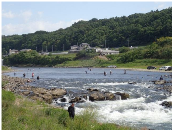
小川地区のようす