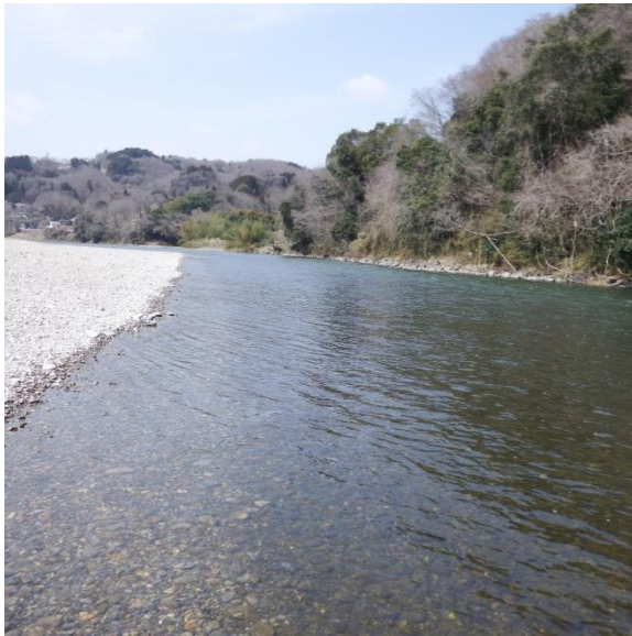
調査場所 (木須川合流付近)