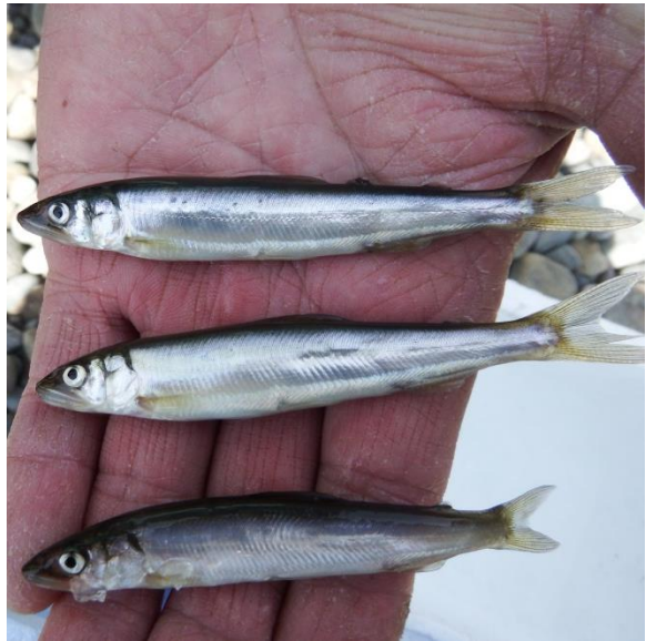
採捕された天然遡上アユ