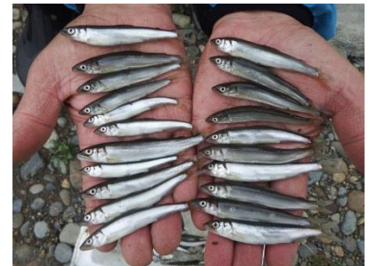
採捕された天然遡上アユ