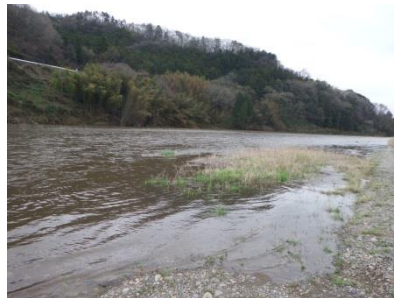
調査場所 (木須川合流付近)