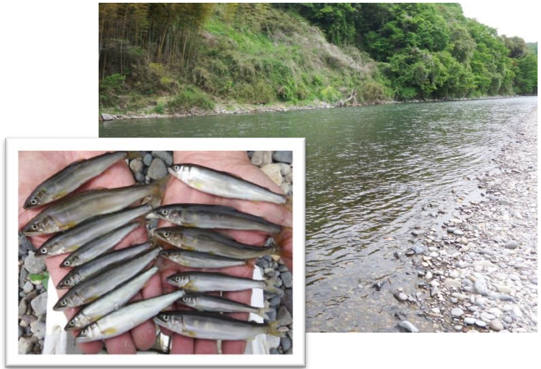
調査場所(木須川合流付近)のようすと採捕された天然遡上アユ