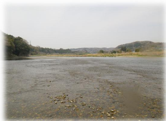
調査地点（テイテイ淵下流）