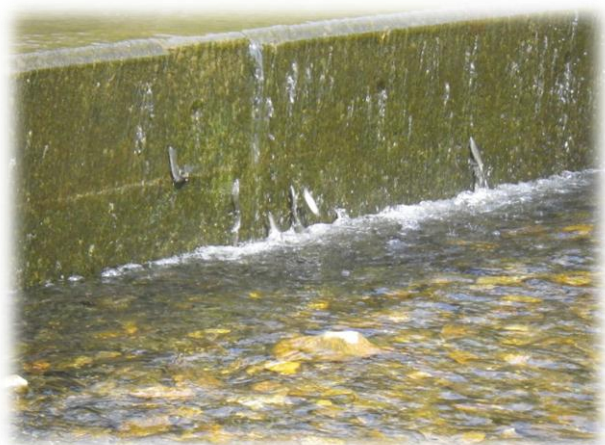
写真1 落合堰を遡上する天然アユ (4/15)