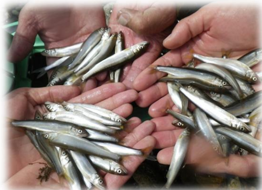
採捕された天然アユ