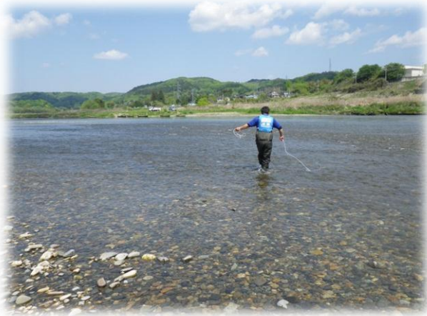
調査地点（テイテイ淵下流）