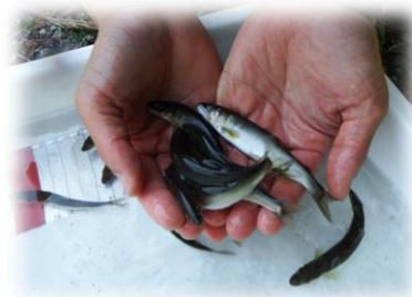
調査地点（稲沢睦橋下流） 採捕された天然アユ