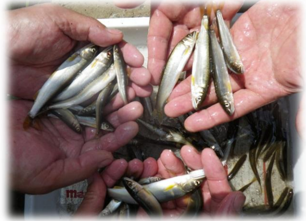
採捕された天然アユ