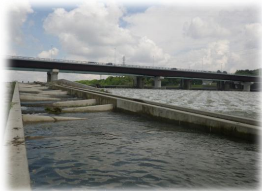
調査地点（勝瓜頭首工下流）