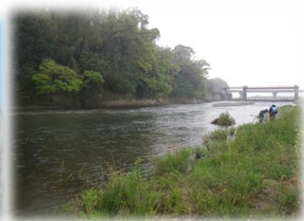
西ノ原頭首工下流