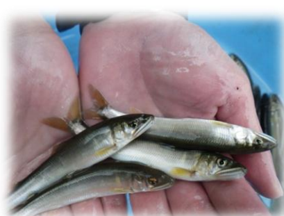
採捕された天然アユ（矢組堰）