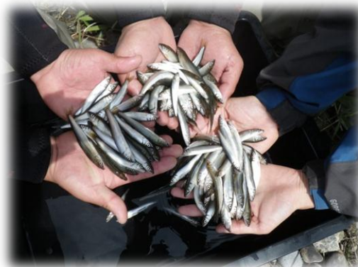
採捕された天然アユ