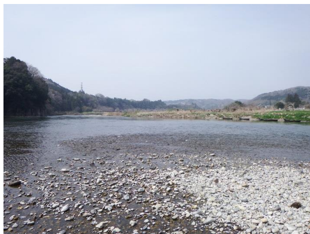
調査場所（テイテイ淵下流）