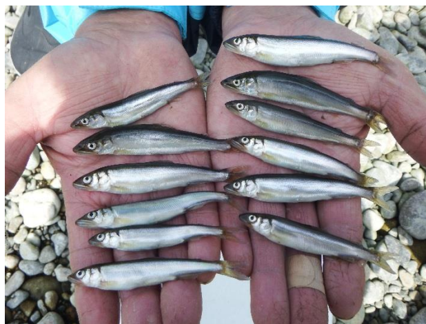
採捕された天然遡上アユ