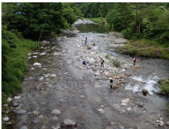
塩沢橋付近のようす

[参考] 2017年6月17日（昨年の解禁日）の平均釣れ具合は3.77尾でした。