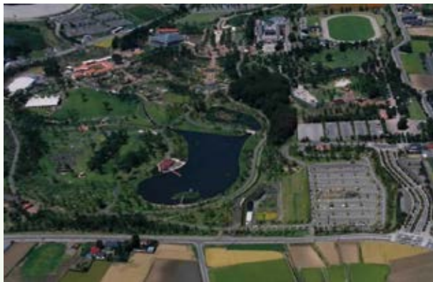
H12.9 とちぎわんぱく公園開園 (壬生町)