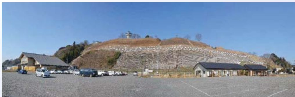
H25.11 災害関連等緊急砂防事業竣工(さくら市倉ヶ崎)