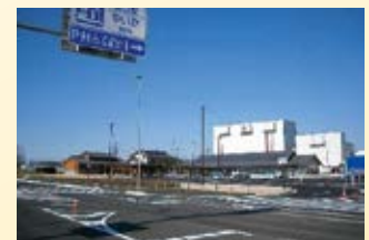
H23.3 道の駅「しもつけ」 (写真上)と「やいた」(写真 下)が供用開始