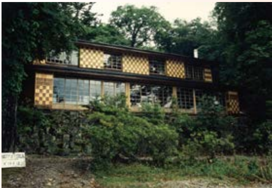
H12.7 旧イタリア大使館夏季別荘改修工事 竣工(日光市)