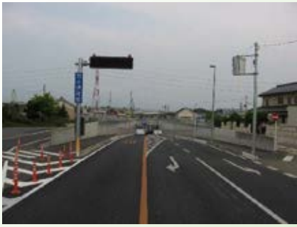
H23.1 (都)間々田北通り 間々田アンダー完成(小山市)