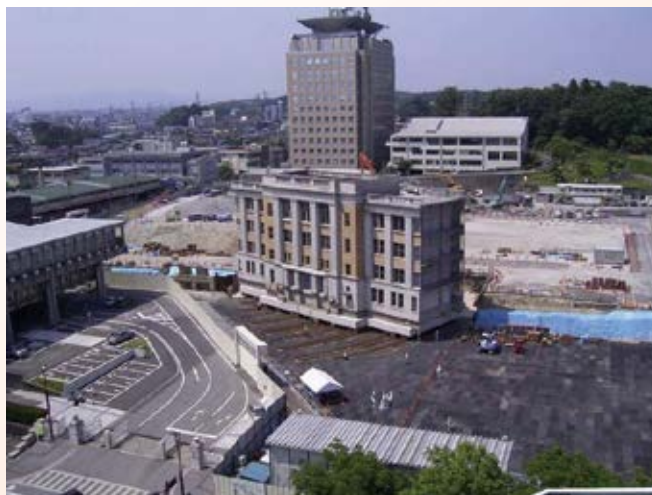
H17.5 旧県庁舎本館移築 (曳家)工事竣工 (宇都宮市)