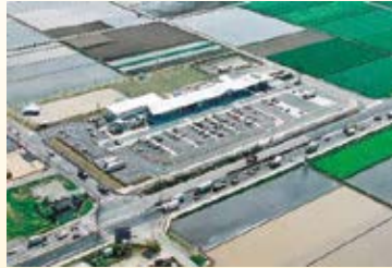
H18.4 道の駅「思川」供用 (小山市)