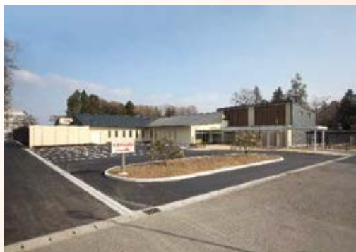
H25.2 岡本台病院医療観察法病棟竣工(宇都宮市)