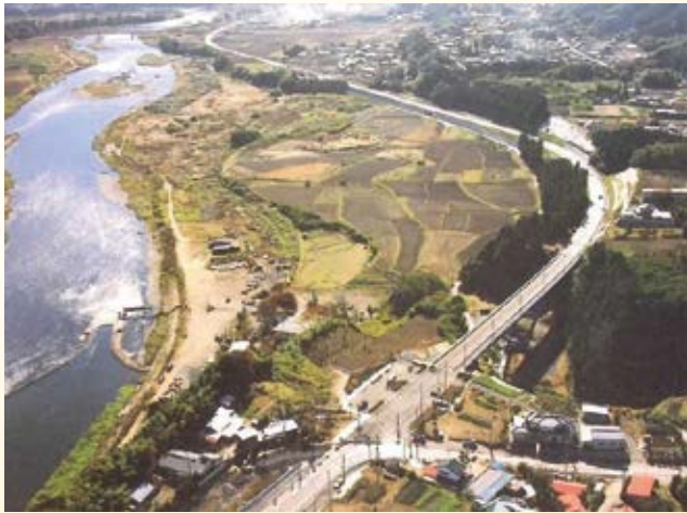
H9.10 (国)294号 烏山 バイパス開通 (那須烏山市)