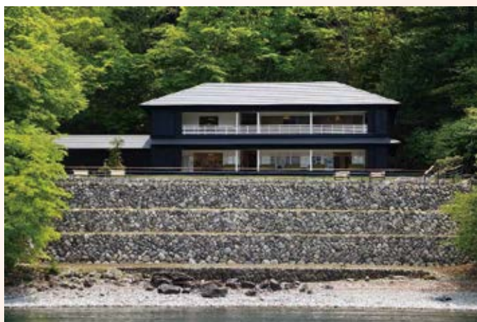
H27.9 旧英国大使館別荘建物復元工事竣工 (日光市)