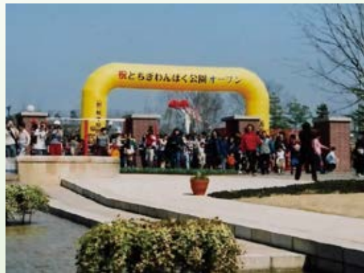
H12.9 第17回全国都市緑化とちぎフェア開幕 (壬生町、宇都宮市)