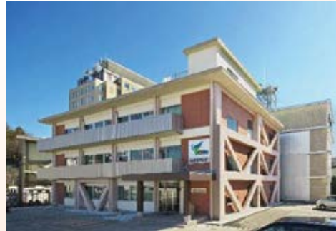
H26.3 元北別館(とちぎTV)耐震その他改修工事竣工(宇都宮市)