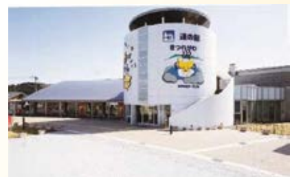
H13.6 道の駅「きつれがわ」供用(さくら市)