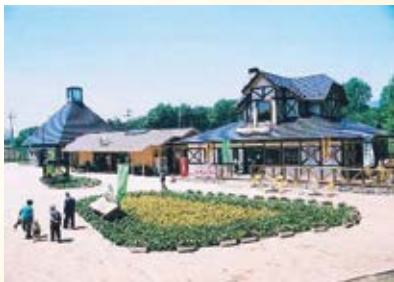
H10.4 道の駅「明治の森・黒磯」供用 (那須塩原市)