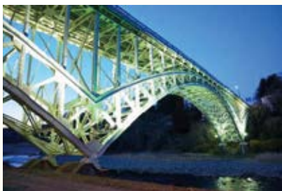
H23.10 晩翠橋(土木遺産)補 修工事完了 (那須塩原市)