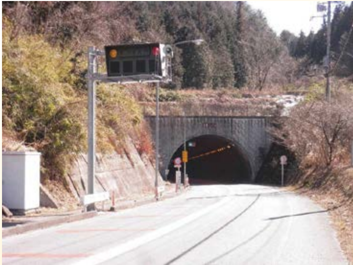
H9.11 (主)大沢宇都宮線 鞍掛 トンネル開通 (日光市,宇都宮市)