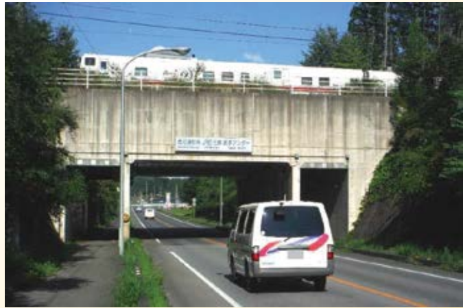
H10.6 (一)鹿沼環状線 武子・栃窪工区開通 (鹿沼市)