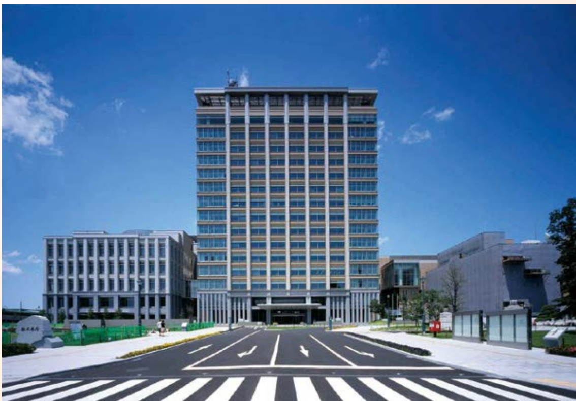
H19.11 県庁舎本館竣工 (宇都宮市)