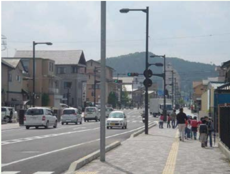
H18.8 (都)古峯原宮通り (下田町工区)完成 (鹿沼市)