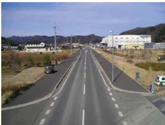
H17.8 (一)飛駒足利線 名草下バイパス (名草下町・菅田町工区)開通(足利市)