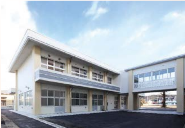
H24.1 矢板東高校・同附属中学校特別教室棟竣工 (矢板市)