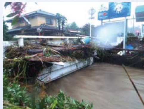
H28.4 小薮川「床上浸水対策特別緊急事業」採択