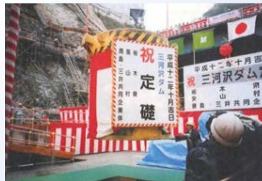
H12.10 三河沢ダム定礎式 (日光市)