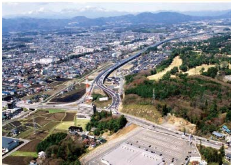
H15.3 (国)119号 宇都宮北道路開通 (宇都宮市)