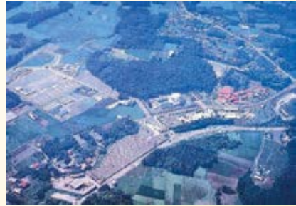
H24.6 道の駅「しおや」(写真上) と H24.9 道の駅「うつのみや ろま んちつく村」(写真下)が供用開始