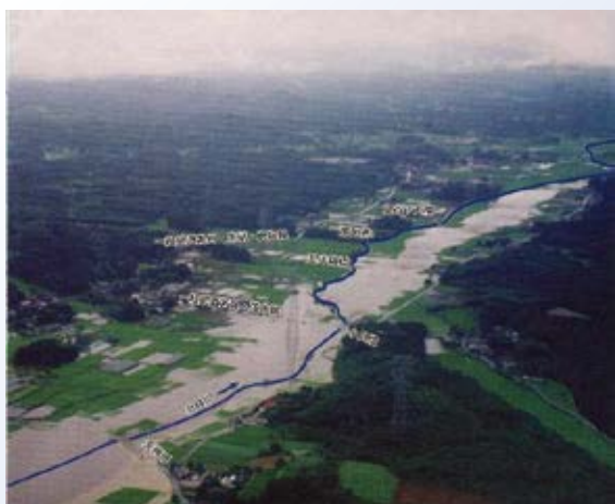
H11.7 梅雨前線豪雨 小貝川出水時 (市貝町)