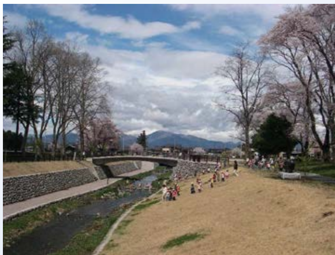
H18.11 百村川床上浸水対策特別緊急事業竣工 (大田原市)