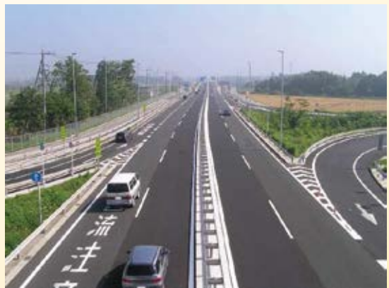
H17.11 (国)408号 常総・宇都宮東部連絡道路 真岡バイパス開通(真岡市)