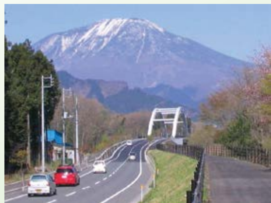
H17.4 日光七里大橋が完成、(都)大谷川 右岸線と(都)瀬川森友線が全線完成(日光市)