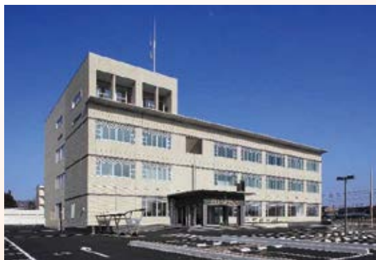
H21.12 那須塩原警察署竣工(那須塩原市)