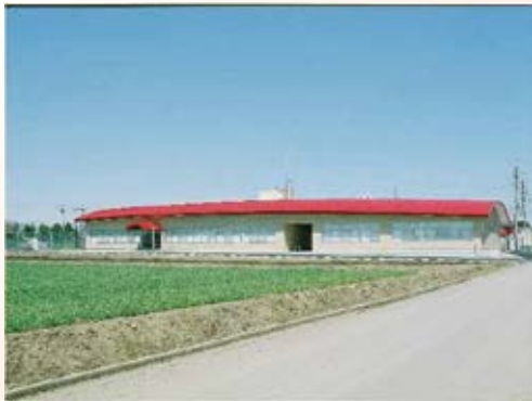
H22.2 農業試験場いちご研究所研究棟竣工 (栃木市)