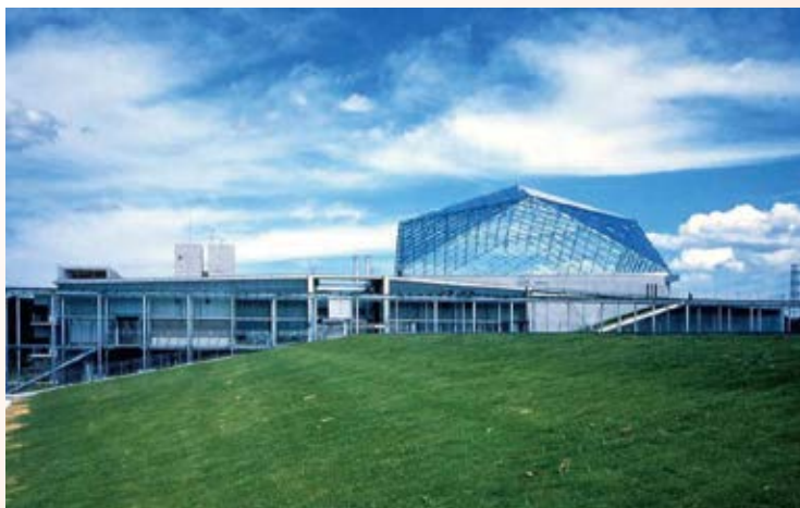
H13.5 ながわ水遊園竣工(大田原市)