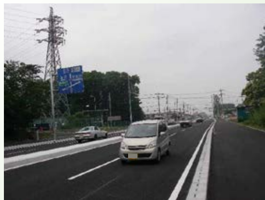
H21.6 (都)黒磯那須北線上厚崎地区のバイパス完成(那須塩原市)