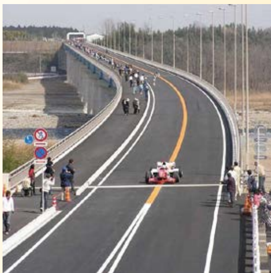
H20.3 (主)宇都宮向田線 平出・板戸工 区(板戸大橋)開通(宇都宮市)