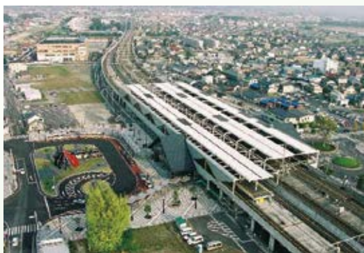
H15.4 栃木駅周辺連続立体交差事業 JR 両毛線高架供用開始(栃木市)