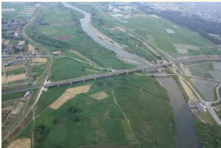
H22.11 (主) 小山環状線 新間中橋開通 (小山市)