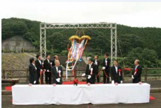
H25.9 寺山ダム ダム ESCO 事業発電開始(矢板市)