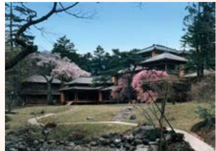
H12.6 日光田母沢御用邸記念 公園修復・復元工事竣工 (日光市)