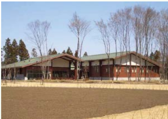
H17.4 日光だいや川公園 「だいや体験館」オープン(日光市)