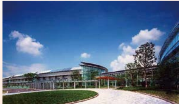
H14.12 産業技術センター竣工 (宇都宮市)