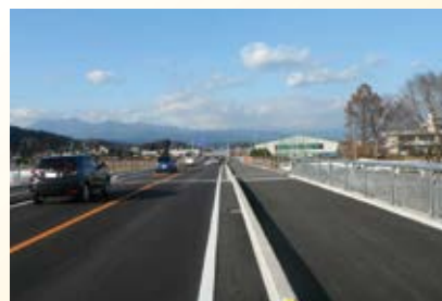
H27.12 (主)矢板那須線 矢板バイパス開通(矢板市)