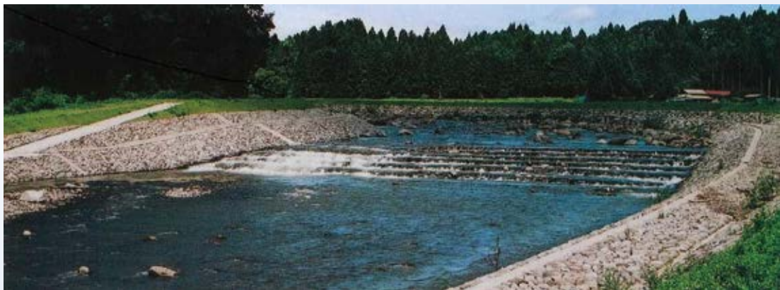
H13.3 余笹川災害復旧事業竣工(那須町)