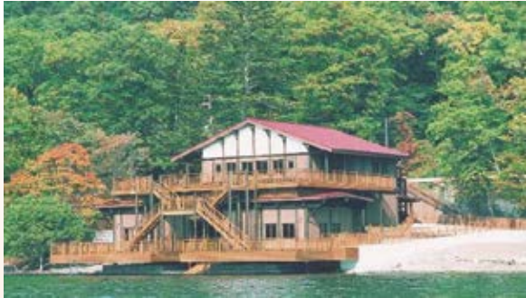
H14.9 中禅寺湖畔ボートハウス竣工 (日光市)