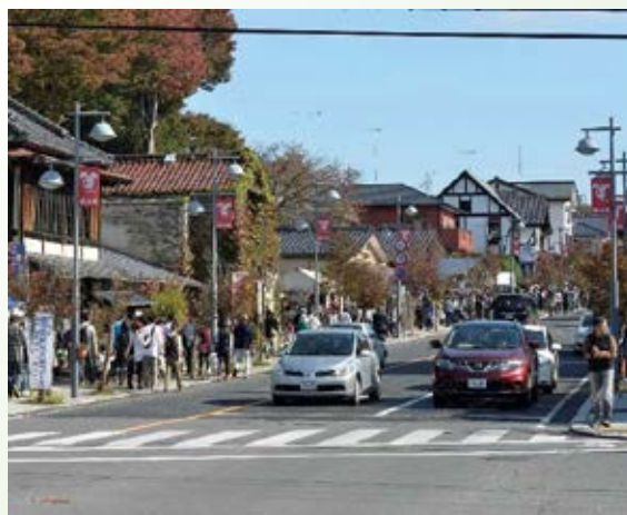
H11.9 (都) 益子南通り開通 (益子町)