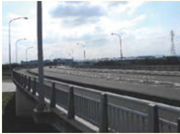
H12.2 主要地方道宇都宮 栃木線 惣社今井バイパス 開通(壬生町,栃木市)