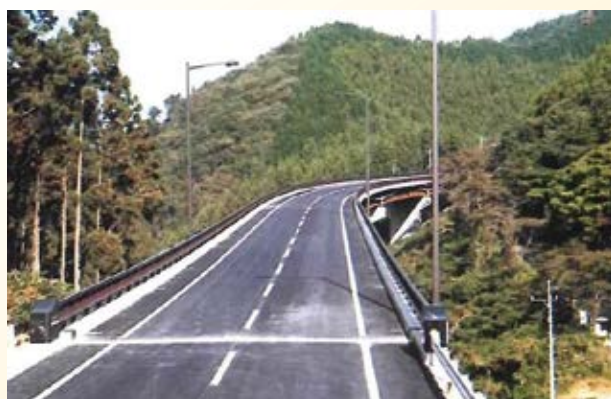
H11.11 (国)293 号 矢又工区(伴睦峠高架橋) 開通(那珂川町)