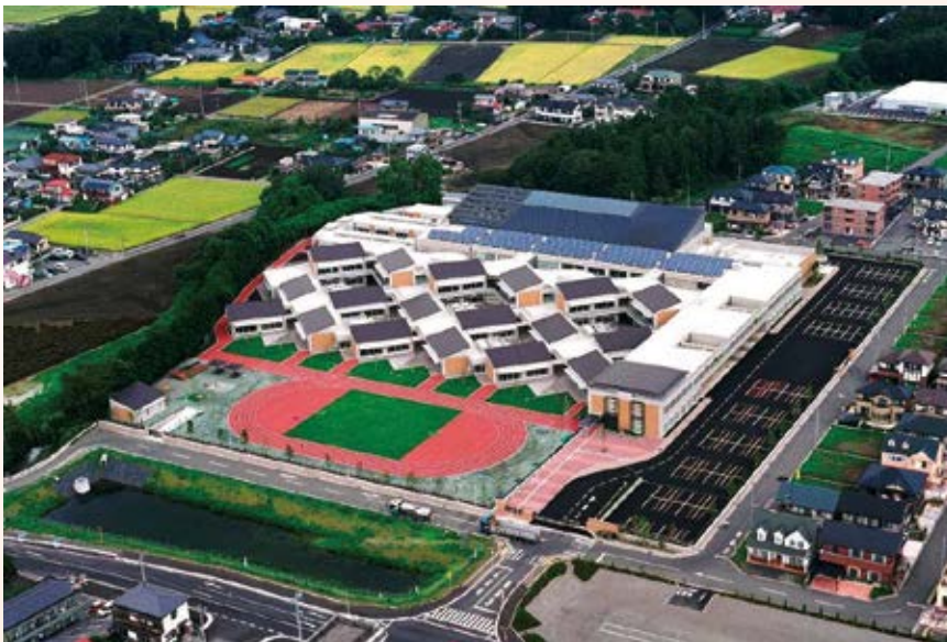
H16.2 のざわ特別支援学 校竣工 (宇都宮市)