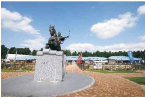
H16.2 道の駅「那須与一の郷」供用 (大田原市)