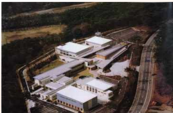
H11.9 県北産業技術専門校竣工 (那須町)