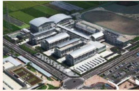
H23.2 宇都宮工業高校新校舎竣工 (宇都宮市)