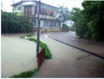
H26.2 小藪川「100 mm/h 安心プラン」登録