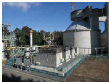
H27.2 鬼怒川上流流域 下水道(中央 処理区)消化ガ ス発電開始