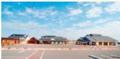
H21.10 道の駅「みぶ」供用(壬生町)