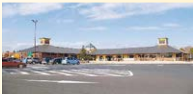
H21.11 道の駅「にしかた」供用(栃木市)