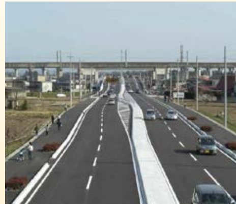
H21.3 (国)400号 大田原西那須野バイパス(JR 跨線橋工区)開通(那須塩原市)