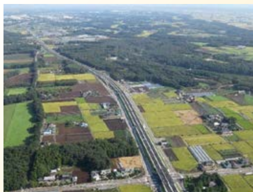
H25.12 (国)408号 常総・宇都宮東部連絡道路 真岡～宇都宮バイパス開通(真岡市、宇都宮市)