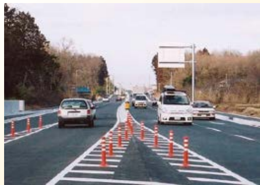
H15.2 (国)294号 八木岡バイパス開通(真岡市)