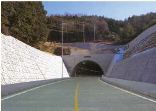
H13.3 (主)宇都宮烏山線 神長工区(神長トンネル)開通(那須烏山市)