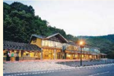
H18.8 道の駅「湯西川」供用 (日光市)