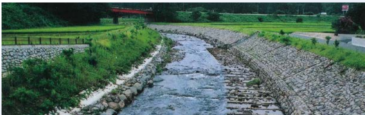
H14.10 黒川、四ッ川災害復旧助成事業竣工(那須町黒川)