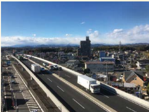
H26.12 (国)119号 宇都宮環状北道路 下川俣陸橋開通 (宇都宮市)