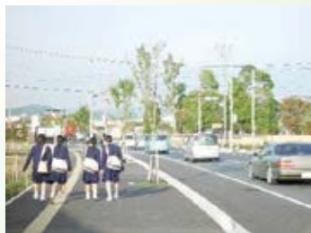
H19.3 (都)樋ノ口 河合線完成 (栃木市)