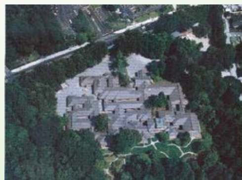
H15.10 日光田母沢御用邸記念公園 全面開園(日光市)