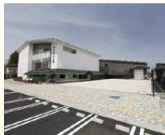
H27.4 道の駅 「日光」供用 (日光市)