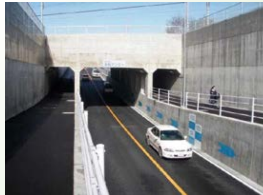
H22.3 (都) 黒袴迫間線 若松アンダー 完成 (佐野市)