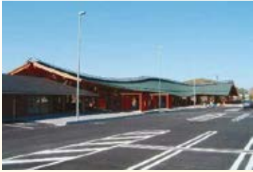
H18.4 道の駅「みかも」供用 (佐野市)