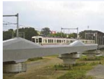
H19.5 思川改修に伴う JR 両毛線第一思川橋梁の改築完了(小山市)