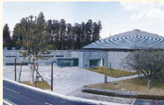
H16.2 「那須野が原博物館」開館 (那須塩原市)