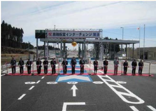
H21.3 高速自動車国道東北縦貫自動車道 黒磯板室インターチェンジ開通(那須塩原市)