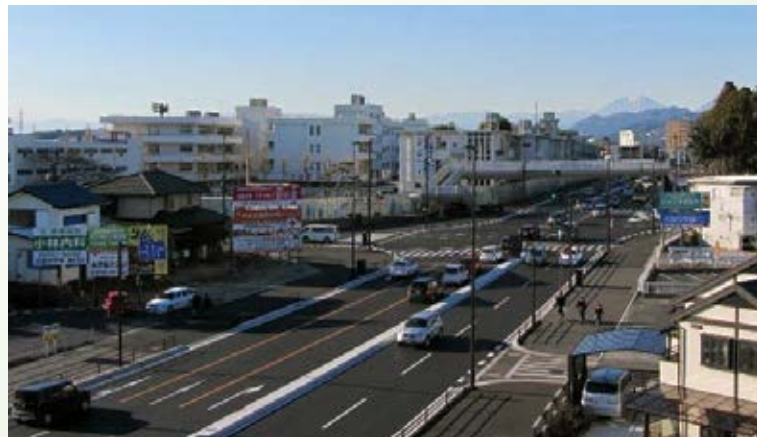
H24.12 (都)大通り 護国神社前交差点拡幅工事完成 (宇都宮市)