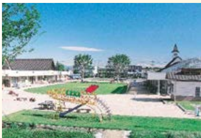
H14.4 道の駅「はが」供用 (芳賀町)