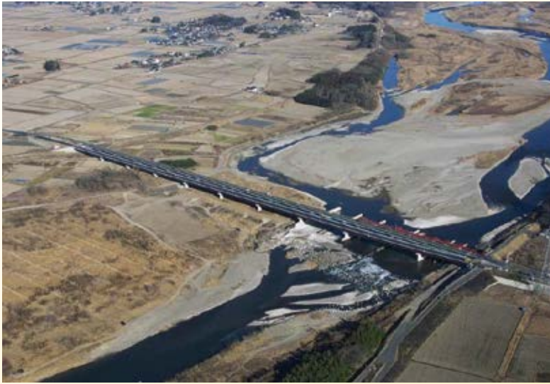
H22.2 (一) 雀宮真岡線 宮岡橋開通 (上三川町、真岡市)