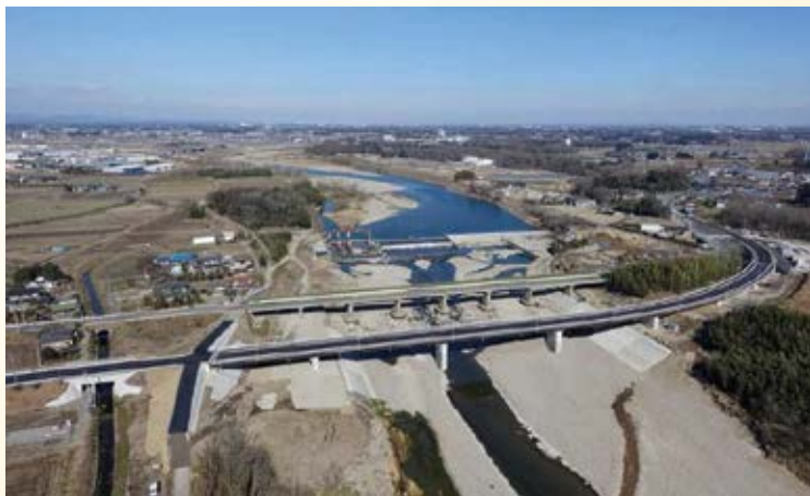
H28.3 主要地方道栃木二宮線 大光寺橋開通 (栃木市,下野市)