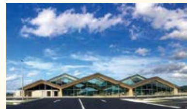
H28.10 道の駅「ましこ」供用 (益子町)