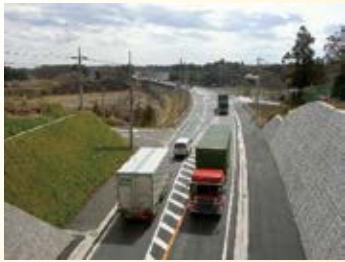
H19.3 (国)294 号 稲沢・寒井バイパス開通 (大田原市、那須町)