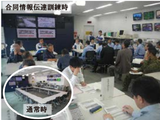
H20.2 県土防災センター(本館13階)運用開始 (宇都宮市)