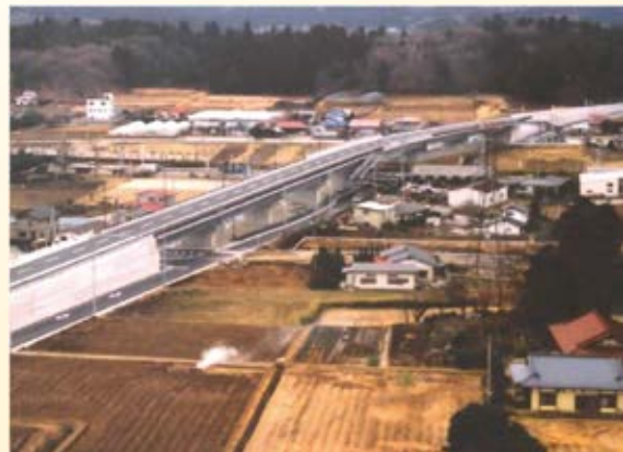
H16.3 (主)矢板那須線 乙畑工区(乙畑跨 道橋)開通(矢板市)