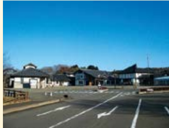
H12.10 道の駅「東山道伊 王野」供用(那須町)