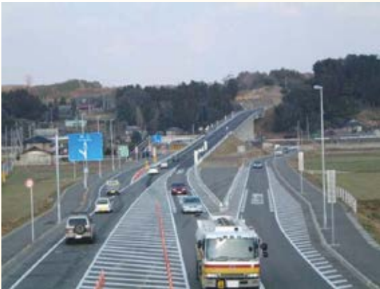
H16.2 (主)宇都宮烏山線 仁井田バイパス (仁井田高架橋)開通(高根沢町・那須烏山市)