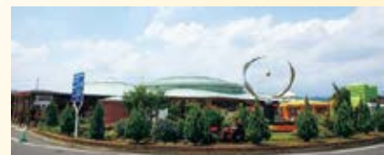
H13.11 道の駅 「どまんなかたぬま」供用 (佐野市)