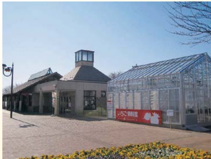
H9.11 道の駅「にのみや」供用 (真岡市)