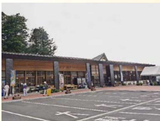
H11.9 道の駅「ばとう」供用 (那珂川町)