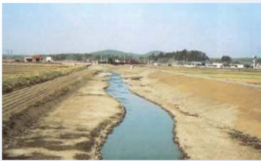
H15.3 小貝川災害復旧助成事業完了 (市貝町)