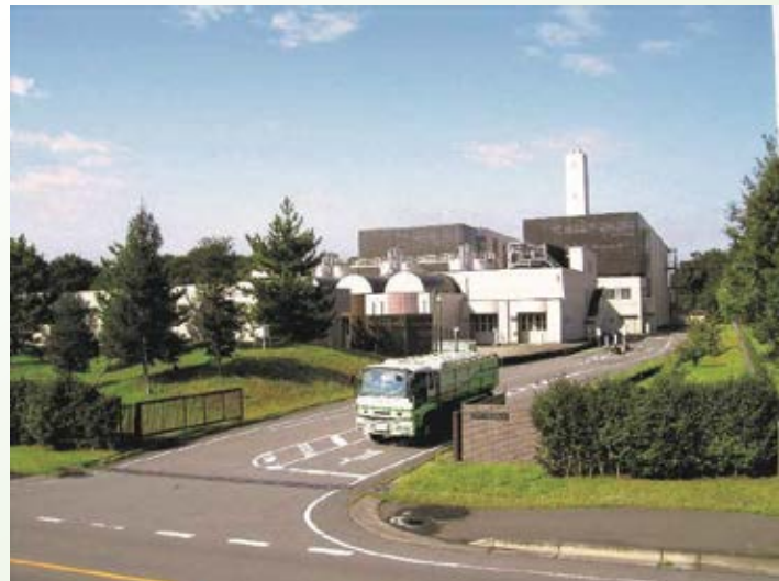
H14.10 栃木県下水道資源化工場供用開始 (宇都宮市)