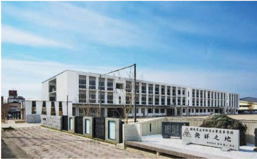
H28.2 栃木県立特別 支援学校宇都 宮青葉高等学 園竣工 (宇都宮市)