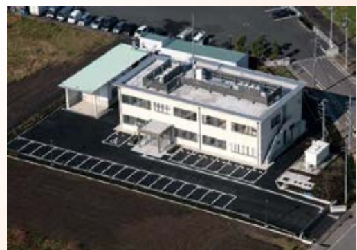
H20.10 県南家畜保健衛生所竣工 (栃木市)