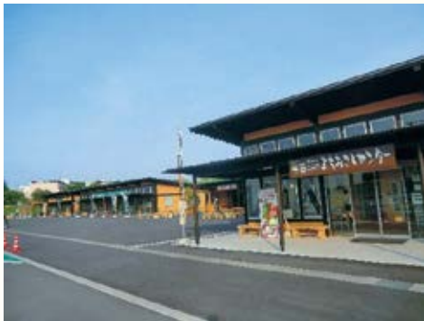
H26.4 道の駅「サシバの里いちかい」供用(市貝町)