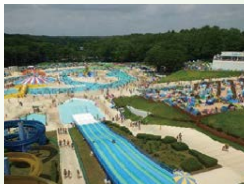
H25.7 井頭公園「一万人プール」リニューアルオープン(真岡市)