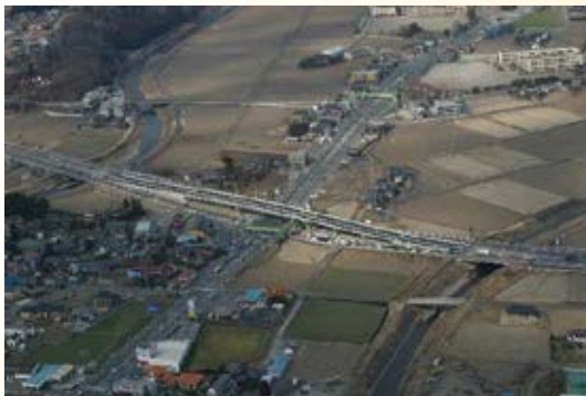
H20.3 (国)119号 宇都宮環状北道路 関堀陸橋開通(宇都宮市)