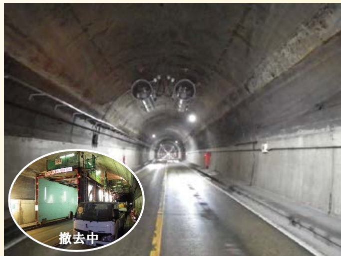
H26.11 日足トンネル 天井板撤去完了 (日光市)