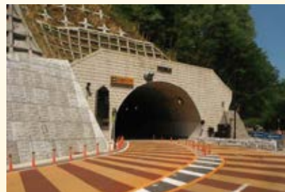
H24.9 (国)400号 下塩原パ イパス(がま石トンネル)開通 (那須塩原市)