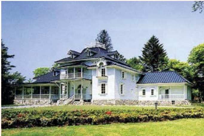
H10.1 旧青木周蔵 邸復元工事竣工 (那須塩原市)