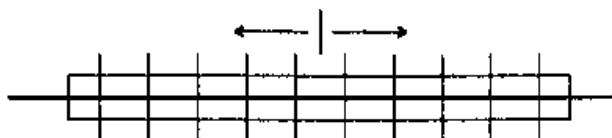
図 4-1 ボルト締付け順序

なお、予備締め後には締め忘れや共まわりを容易に 確認 できるようにボルトナット及び座金にマーキングを行うものとする。これ以外の場合は、監督員の 承諾 を得なければならない。