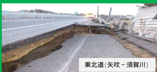
東北道(矢吹～須賀川)