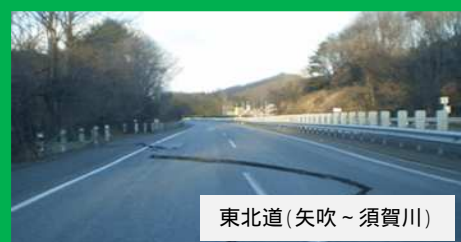
東北道(矢吹～須賀川)