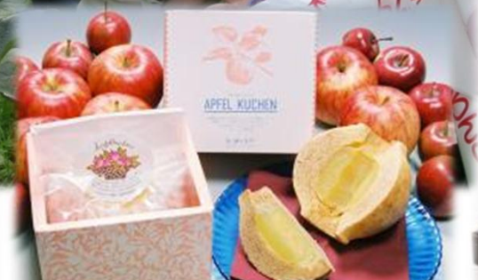
アップルクーヘン