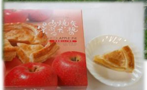
矢板の焼いたあっぷるパイ