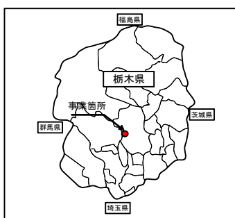
県道宇都宮鹿沼線