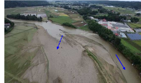
越水による被害状況