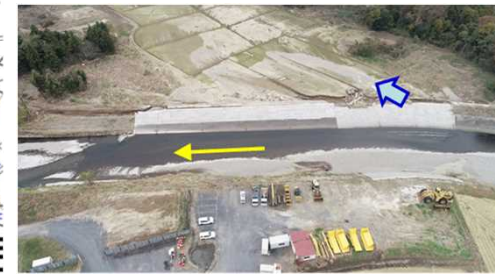
護岸の被災と浸水被害の状況