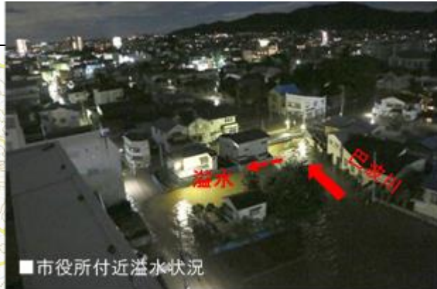
巴波川地下捷水路