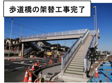
歩道橋の架替工事了