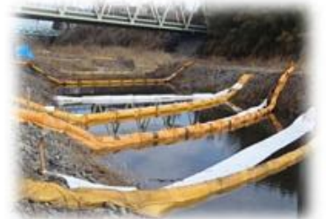
オイルフェンスの設置