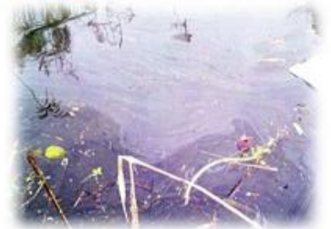
川に流れ込んだ油

なお、原因は生コン工場でタンク車から貯蔵タンクに軽油を移送中に誤って流出させ、その一部が工場西側の同用水路に流れ込んだものです。