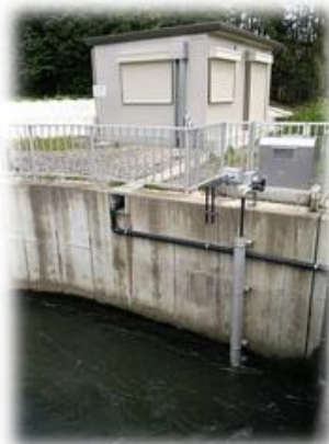
油分検出装置建屋と検水管