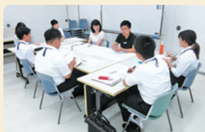
先輩との交流会の様子

栃木県では、学生のインターンシップ受入れを行っています。令和元(2019)年度は行政職向け77所属、技術職向け42所属で募集を行いました。