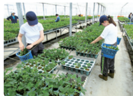
技術職向けインターンシップの様子