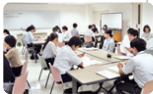
新採用職員前期研修

政策形成能力の向上を目指す政策立案研修や、政策の普及啓発やPRの効果的な手法を学ぶ戦略的情報発信研修等を開講しています。