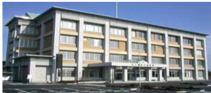
栃木警察署の管轄となる2駐在所